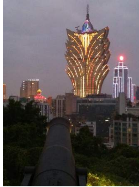
Das Grand Lisboa Casino/Hotel vom Monte Fort aus

Macau hat mit dem Macau-Pataca (MOP) eine eigene Währung mit fixem Wechselkurs 1 HKD = 1,03 MOP. Bezahlen kann man aber überall auch mit Hong Kong Dollar (zu einem 1:1-Kurs), wobei man außerhalb der Casinos aber damit rechnen muss, das Wechselgeld in Pataca zu bekommen.