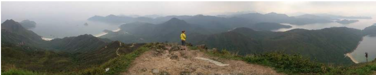
Foto vom Sharp Peak aus: Links die Strände von Tai Wan, rechts der Strand von Nam She Wan.

Vergleichsweise leicht zu begehende betonierte Pfade führen vom Chek Keng Pier zu den großen Stränden von Tai Wan ( Wan heißt Bucht). Da keine Straße zu ihnen führt, sind sie im Gegensatz zu den Stränden auf Hong Kong Island auch im Sommer nicht überlaufen. Einige hundert Meter südlich der Strände, bei N 22.402331°, E 114.366853°, befindet sich ein Wasserfall des Flusses Sheung Luk , an dem man sich im Klippenspringen üben kann. Von dort aus kann man auch noch weiter flussaufwärts wandern, wobei man häufig um ein wenig klettern nicht herumkommt.