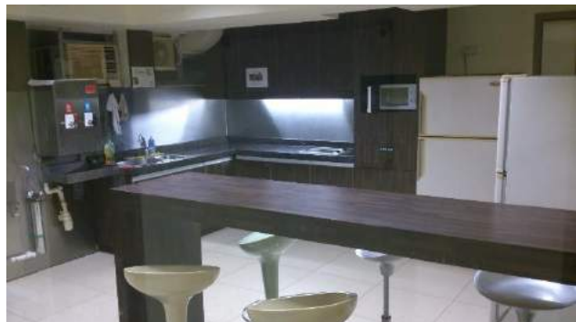
Die Küche meines Hostels

In jedem Stockwerk meines Hostels gab es ein Gemeinschaftsbad sowie eine Küche. In meinem Fall war die Küche mit einem Herd und Mikrowelle ausgestattet, allerdings ohne Backofen. Ferner gab es einen Trinkwasserspender (kaltes und heißes Wasser, Leitungswasser sollte man nicht trinken) sowie zwei Kühlschränke, was absolut ausreichte, da diese kaum genutzt wurden – ich habe einige Storys von Lebensmitteldiebstahl aus Kühlschränken gehört. Kochequipment wurde ebenfalls nicht zur Verfügung gestellt.