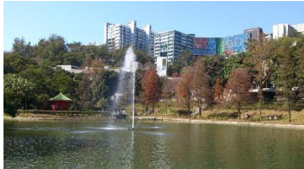
Vorne der Lake Ad Excellentiam , hinten die vorderen Gebäude des Main Campus

Der ungewöhnliche Campus der CUHK ist wohl so etwas wie ein Markenzeichen dieser Universität: Ungewöhnlich deshalb, weil die ganze Universität einfach auf einen Berg gebaut wurde. Am südlichen Fuße des Berges befindet sich die MTR-Station University . Betritt man hier den Campus, so trifft man zunächst auf eines der beiden Sportstadien sowie den Lake Ad Excellentiam , ein kleiner See, der in eine Parkanlage eingebettet wurde. Neben dem See, immer noch mehr oder weniger am Fuße des Berges, befindet sich der Yasumoto International Academic Park – ein relativ neues und gewaltiges Gebäude, in dem das OAL ebenso untergebracht ist, wie einige Hörsäle, Unterrichtsräume und ein Buchladen.