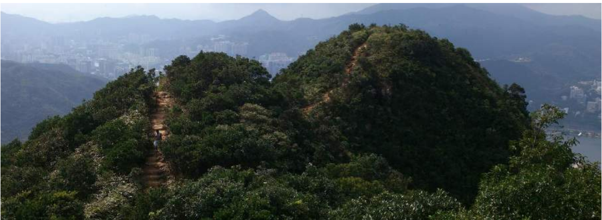
Wanderweg im Ma On Shan Country Park

Die Anzahl der Studenten pro Kurs ist im Schnitt deutlich geringer als am KIT. Die Kurse, die ich besucht habe, wurden von rund 40 Studenten besucht. Die Vorlesungen sind vom Stil – je nach Professor – zwischen denen am KIT und dem deutschen Schulunterricht anzusiedeln. In einigen Kursen fließt sogar die Mitarbeit geringfügig in die Note mit ein. Die Anwesenheit in Vorlesungen oder Tutorien wird dennoch nicht kontrolliert. Für Langschläfer ist die CUHK vermutlich eine gute Wahl: Vor 09:30 Uhr sind in der Regel keine Veranstaltungen angesetzt.