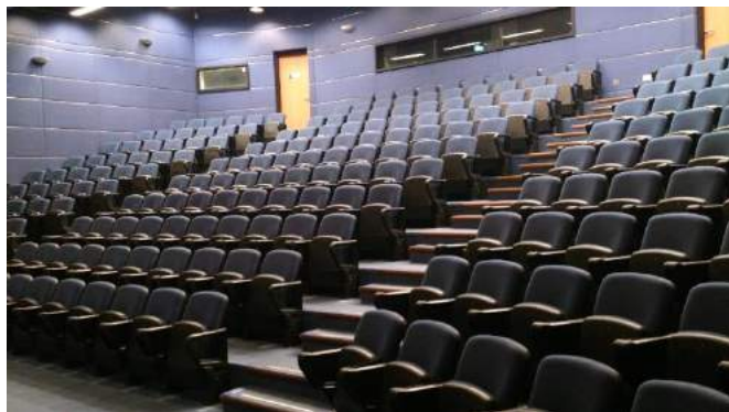
Großer Hörsaal im Mong Man Wai Building

Es gibt Ups und Downs was die Hörsäle angeht: Da die Studentenzahl pro Kurs häufig deutlich geringer ist als am KIT, finden viele Veranstaltungen in Räumen statt, die eher Klassenzimmern und nicht Hörsälen entsprechen. Dort besteht die Einrichtung oft aus billigen Plastiktischen und -stühlen (die gleichen Stühle wie der Stuhl in meinem Zimmer ). Natürlich gibt es aber dennoch auch große Hörsäle und diese sind denen des KIT oft überlegen; die Stühle gleichen eher Kinositzen und haben nicht selten Armlehnen. Der Nachteil an dem Konzept ist, dass die Schreibunterlage auf eine 40 mal 40 Zentimeter große Plastikplatte schrumpft, die sich aus der Armlehne ausklappen lässt. Die technische Einrichtung ist Standard: Natürlich gibt es in jedem Hörsaal/Klassenzimmer einen Beamer. Ein weiterer Unterschied zum KIT ist, dass an der CUHK keine Kreidetafeln verwendet werden, sondern ausschließlich Whiteboards mit Filzstiften.