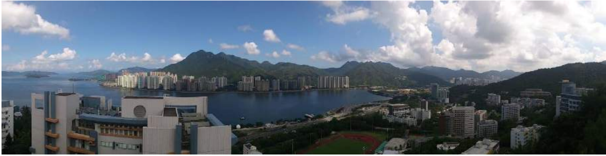
Übersicht dank Hügellage: Ausblick vom Dach der Chih Hsing Hall des New Asia Colleges

Das Unterrichtssystem weicht vor allem in einem Punkt von dem des KIT ab: In den ersten zwei, drei Wochen eines Semesters, der add and drop period , kann man beliebige Kurse besuchen. Innerhalb dieser Phase muss man sich allerdings auch auf Kurse festlegen, diese Kurse bis zum Semesterende durchziehen und die Klausur mitschreiben, auch wenn man während des Semesters merkt, dass der Kurs unter Umständen schwieriger ist, als gedacht. Anders als am KIT kann man nicht einfach die Klausur nicht mitschreiben, um ein Durchfallen zu vermeiden (siehe auch Kurswahl ).