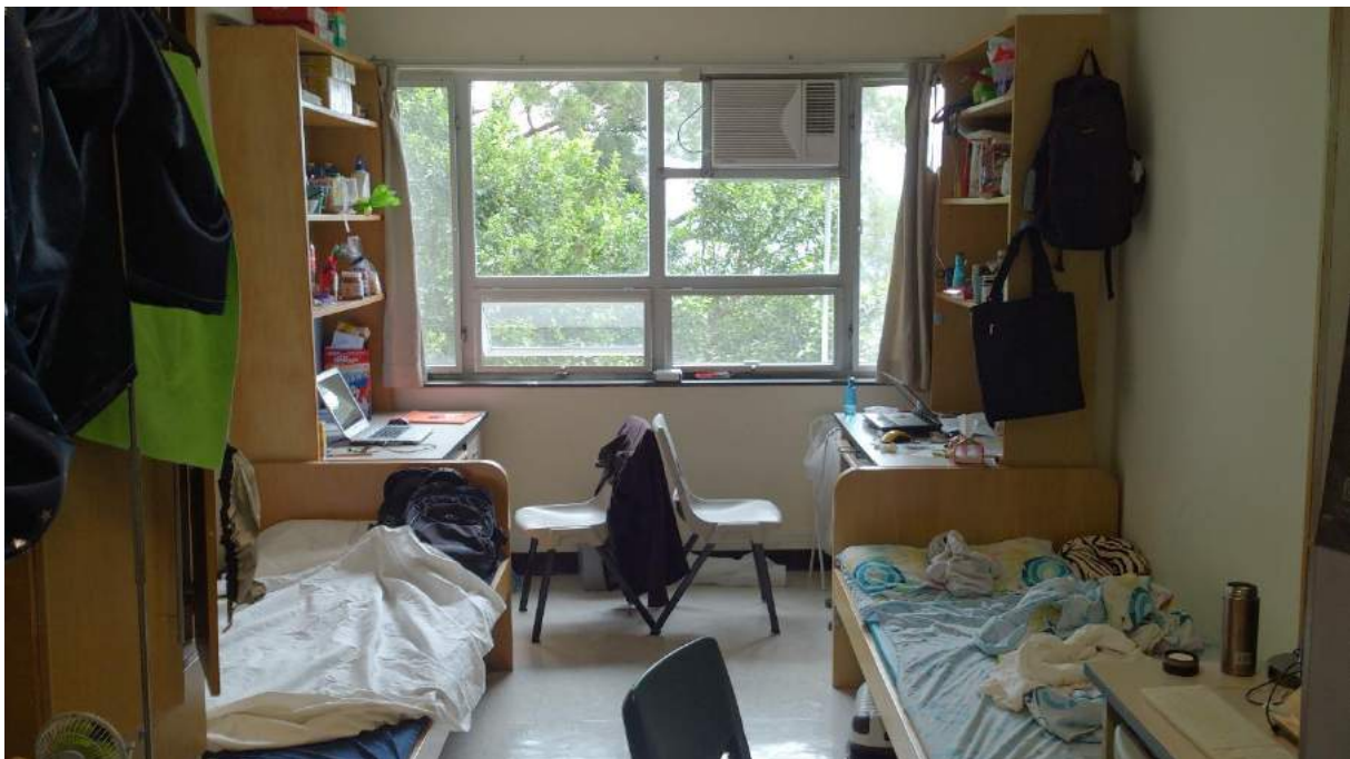
Mein Zimmer im Hostel namens Chih Hsing Hall . Nicht zu sehen sind: Ein drittes Bett (vorne links) und zwei weitere Kleiderschränke (vorn rechts).

Im ganzen Hostel hat man W-LAN empfang, die Geschwindigkeit variiert dabei, nach allem was ich gehört habe, allerdings stark von Hostel zu Hostel. Im Zimmer hat auch jeder einen LAN-Kabel-Anschluss.